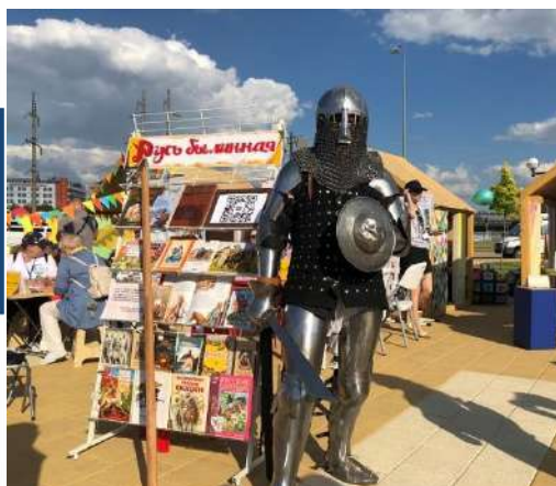
«Белая акация» приносит новые замыслы и новое вдохновение!