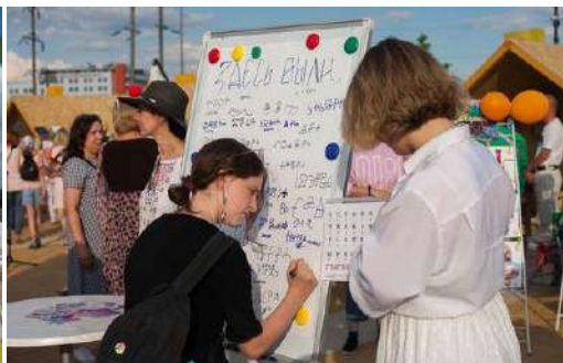
ФОТОЗОНА «ФОТОсет на память»