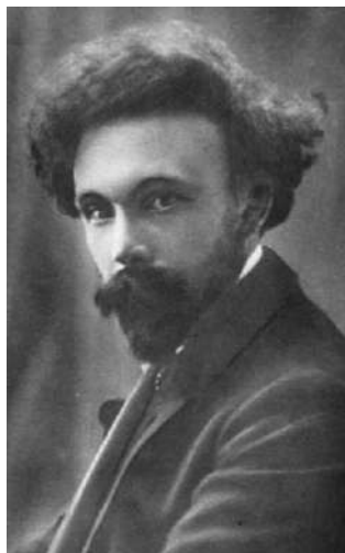
Пришвин в молодости, около 1900 г.

Вообще, процесс созревания, окончательного формирования был у Пришвина долгим и завершился лишь в годы Первой мировой войны.