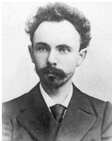
Михаил Пришвин, 1901 г.

Лекции учёных, сочетавших гуманитарные и точные знания, чтение натурфилософских работ И. В. Гёте способствовали зарождению у Пришвина идеи слияния науки и художественного творчества в познании тайн живой жизни. При встрече с «многообразием европейской жизни», под влиянием увлечения науками и «прозрения в мещанство социал-демократии», его «фантастический» марксизм начал «рассасываться бессознательно» – произошёл «переворот от теории к жизни».