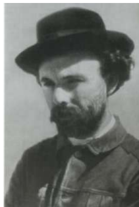
М. М. Пришвин. г. Новгород, конец 1910-х гг.

Вскоре он отходит от «богоискателей»: разочаровало, что они пишут «тайнственно», а говорят и живут «обыкновенно».