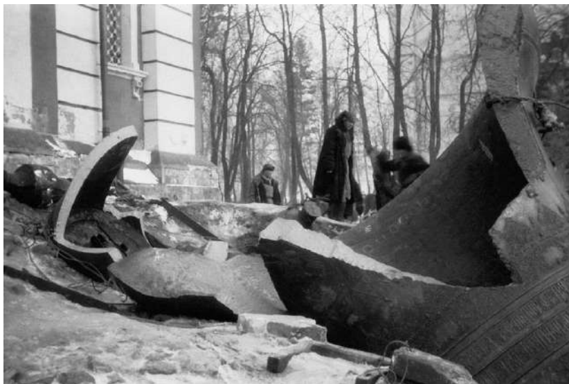
Сброс колоколов в Троице-Сергиевой лавре. Сергиев Посад, январь 1930 г.

♦ Расправу с колоколами запечатлел на фото и в дневниковых записях. На коробке с сотнями негативов, сделанных зимой 1929/1930 г., пронзительная надпись: «Когда били колокола».