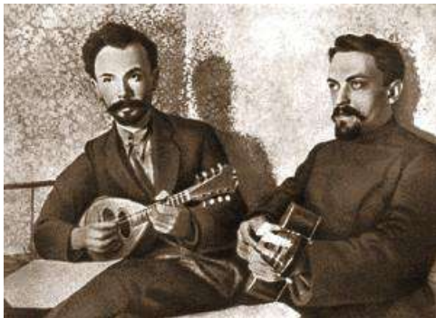
М. Пришвин и Н. Семашко в студенческие годы, г. Елец

После окончания училища, в 1893 г., не поддавшись уговорам бездетного дяди унаследовать его дело, Михаил уехал в Елабугу и сдал там экстерном экзамены за полный курс классической гимназии. Осенью того же года он поступил на агрономическое отделение химического факультета Рижского политехникума.